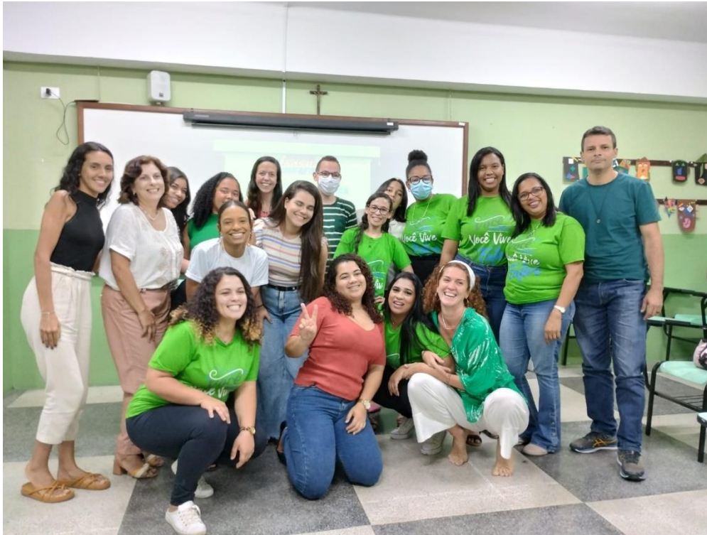
Encontro de encerramento do Programa de Residência Pedagógica